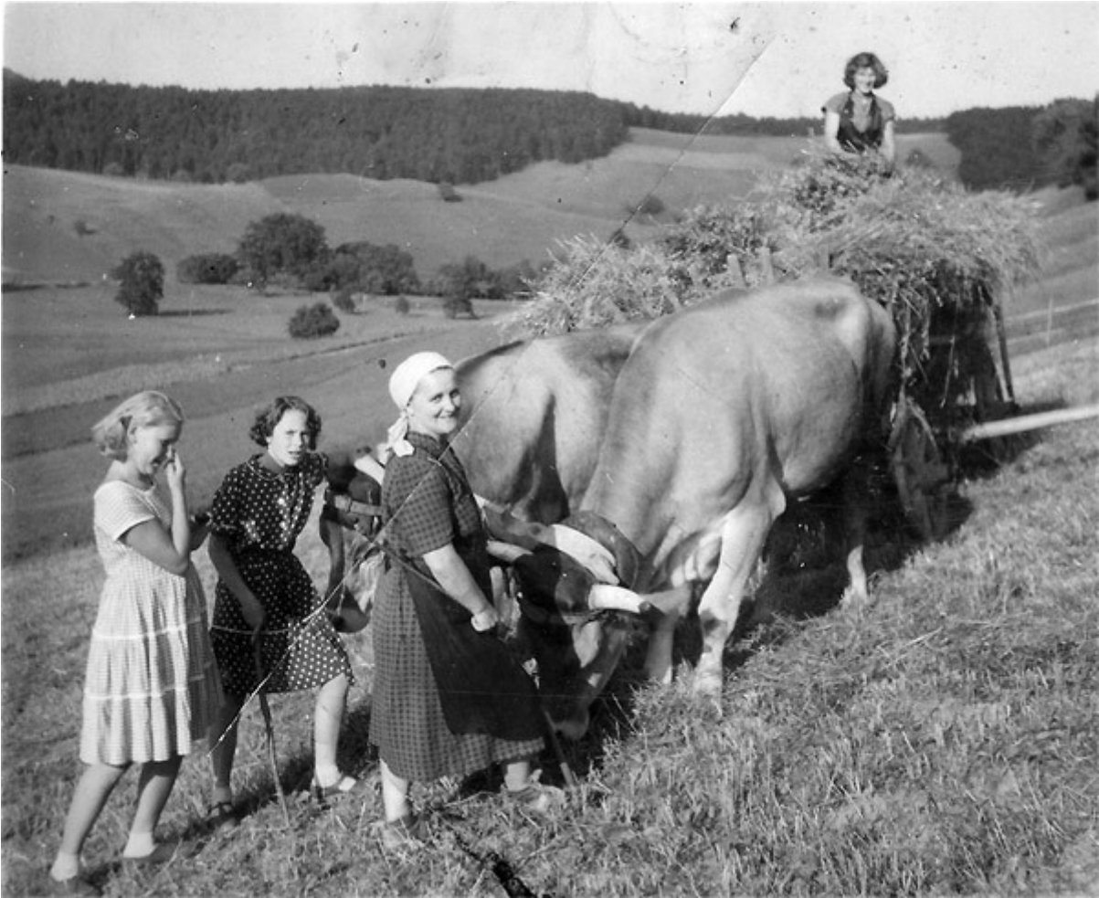
Heuernte anno 1949 in Schrattenbach Handarbeit von Frauen und Kinder mit Rechen und Heugabel und mit Hilfe von Murbodner Ochsen als Zugtiere am Karrenwagen